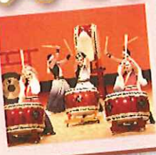
<写真> 南会津町 田島太鼓囃子会