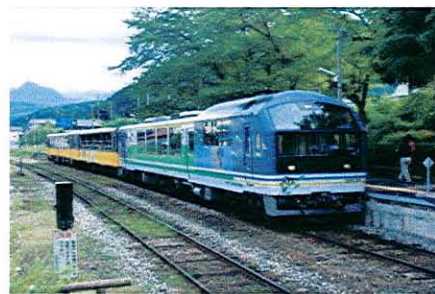
「お座トロ展望列車」