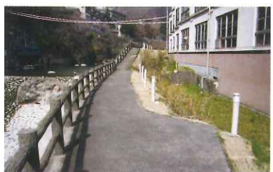
男鹿川河川遊歩道 (MAP 3)

川治温泉の中心を流れる男鹿川沿いには遊歩道が整備され、川を泳ぐ魚を見ながら散策が楽しめます。また、薬師の湯や川治ふれあい公園にも隣接し川治温泉散策時のオススメルートです。