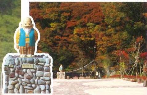
川治ふれあい公園 (MAP 1)

平成22年3月に完成した公園で、川治温泉のキャラクター「かわじい」さんがお出迎え。イベントスペースを兼ねた東屋や多目的トイレ、「かわじいの湯」「結びの湯」の二種類の足湯が楽しめる。また併設されている「かわじいふるさとの駅」には観光案内を兼ねた休憩所があり、お茶や川治の美味しい水が無料で飲めます。川治温泉街散策の際は是非寄りたいたスポット。