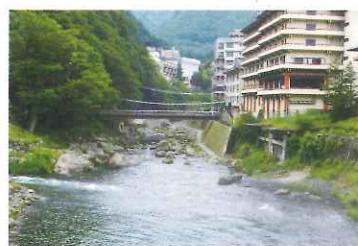
男鹿川 (MAP 4)

川治温泉の中心を流れる男鹿川沿いには遊歩道が整備され、川を泳ぐ魚を見ながら散策が楽しめます。また、薬師の湯や川治ふれあい公園にも隣接し川治温泉散策時のオススメルートです。