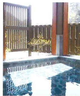
川治温泉 薬師の湯 (MAP 2)

神経痛、関節痛、慢性消化器病。肌にやさしい温泉であることから「美肌の湯」として人気があります。男風呂、女風呂、貸切風呂、低温サウナ(男女各1)、休憩施設、利用時間(10時～21時)、入浴料(市外一般500円/小学生300円)