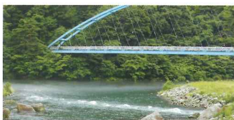
あじさい公園 (MAP 5) と黄金橋 (MAP 6)

鬼怒川と男鹿川の合流点に架かる歩行者専用の橋で名前の由来はこの地に伝わる黄金伝説をもとに名付けられました。橋を渡った先には種類豊富なあじさいが楽しめるあじさい公園があります。