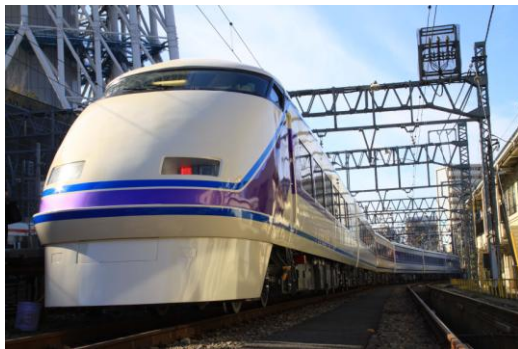
△特急「スペースシア」（リニューアル車両）

また、会津鉄道からの直通運転列車はすべて鬼怒川温泉駅で東武線内の特急列車と接続します。