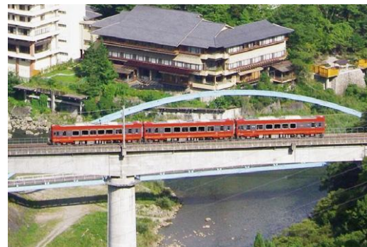
△「AIZUマウントエクスプレス号」