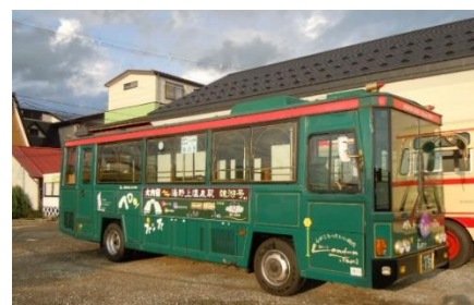
▲レトロバス猿遊号