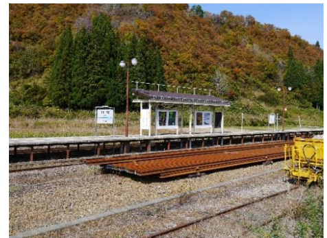
只見駅ホームの様子