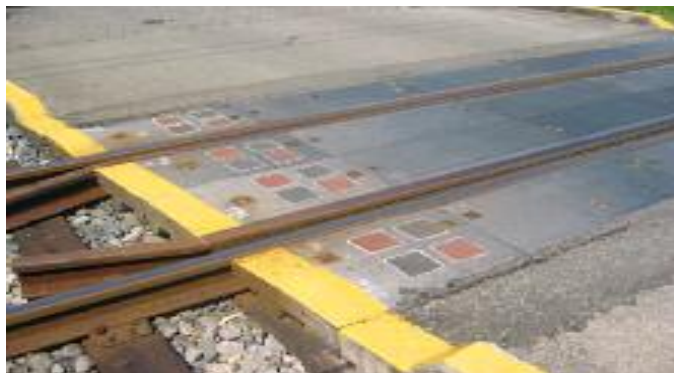
(転倒防止のスベリ留め)

踏切の安全対策については、踏切道に通行者用の滑り止めを設置し、転倒防止対策をしています。