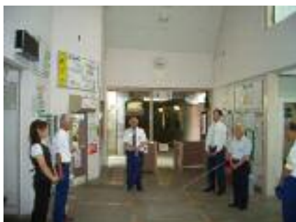
(総点検 職場巡回社長訓示)

年2回実施される「輸送の安全」総点検運動期間中、経営トップ及び取締役が現業職場を巡回し、運転事故防止と安全意識の徹底を図るとともに通常業務に対する慰労と協力及び実作業の確認を行っております。