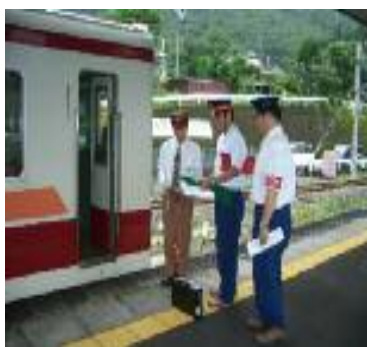
(当務駅長より指導者を受取る)