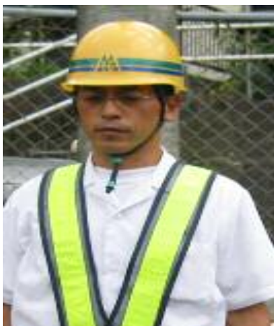
(安全ベストの着用)

職員が、線路内および線路に近接する作業にあたる際は、安全ベスト(V字型の蛍光色を配したベスト)を着用し列車からの視認性向上を図るなど、安全性を確保しています。