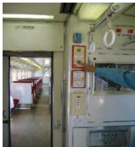
(車内の非常報知器)