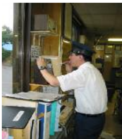
(アルコール検知風景)

直ちに従業員の資質管理の徹底を図り、尚且つ勤務を控えての飲酒禁止の徹底と運転士及び車掌には出勤時にアルコール検知器を使用して、再度乗務前の確認を実施しております。