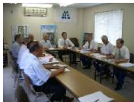
運転事故防止対策委員会