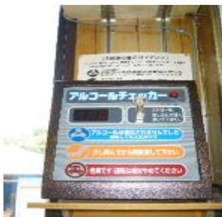
(アルコール検知器)