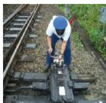
(転てつ機の手回し訓練)