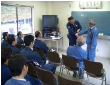
(警察との実践訓練)

野岩鉄道は、毎年1回異常時総合訓練を実施しています。これは、地元消防署や警察署と協力して訓練を実施するもので、不審物・不審者などテロによる事故・急病人発生時および酔客の対応法など実践的に訓練し知識、技能の向上を目的としています。