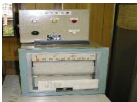
(地震計震度表示装置)