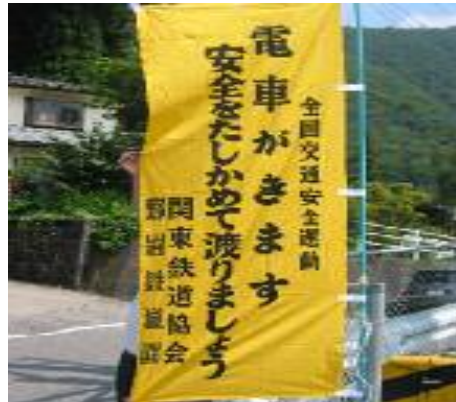
(交通安全のぼり旗)