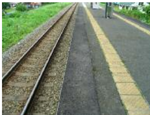
アスファルト舗装(下り方)

お客さまが足を滑らしてケガおよびホーム下に転落しないようにコンクリート製の笠石からアスファルト舗装に変更しています。