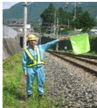
(列車接近了解合図)