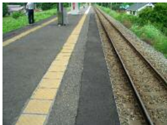
アスファルト舗装(上り方)