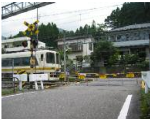
(電車が直ぐ近くです)

万が一、車が踏切内に閉じ込められた時は——▶ 遮断桿(しゃだんかん)を車で押して脱出してください!