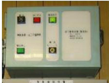
(落石検知表示装置)