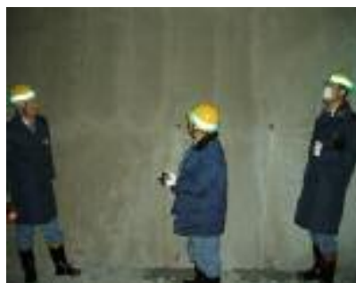
(総点検 トンネル内巡回)