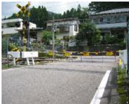
(入ってしまったら車でそのまま押してください)