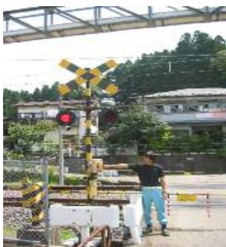
(踏切用非常ボタン)