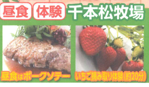
昼食 体験 千本松牧場