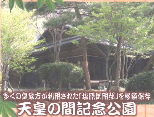
多くの皇族方が利用された「塩原御用邸」を移築保存 天皇の間記念公園