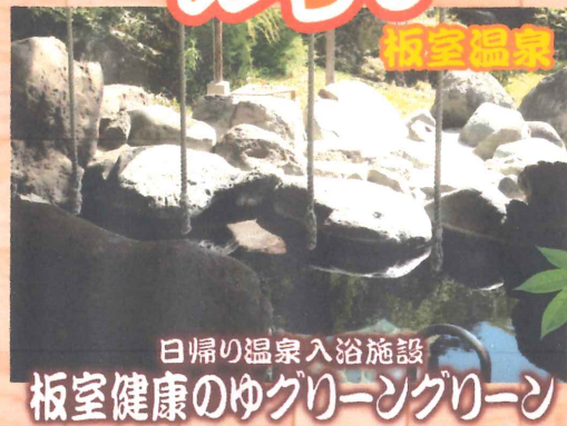
日帰り温泉入浴施設 板室健康のゆぐりーんぐりーん