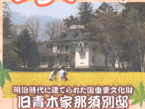
明治時代に建てられた国重要文化財 旧青木家那須別邸