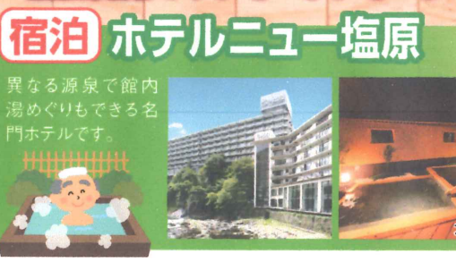
宿泊 ホテルニュー塩原