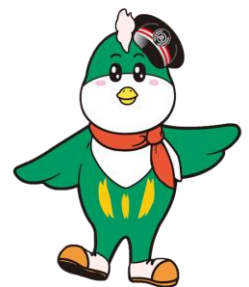
野岩鉄道「やがぴい」

野岩鉄道株式会社 総務部総務課 TEL 0288-77-3300 FAX 0288-76-0819