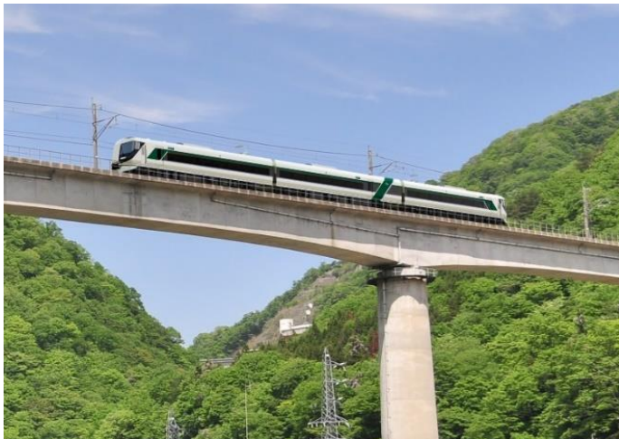
野岩鉄道会津鬼怒川線を走行する「特急リバティ会津」（イメージ）